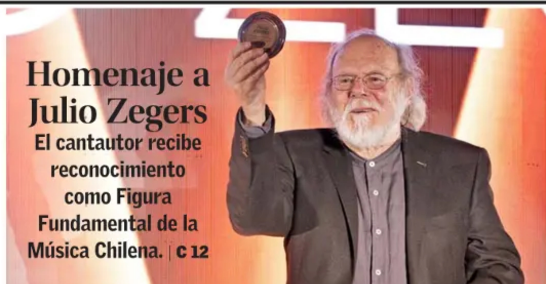
Homenaje a Julio Zegers El cantautor recibe reconocimiento como Figura Fundamental de la Música Chilena. | c 12